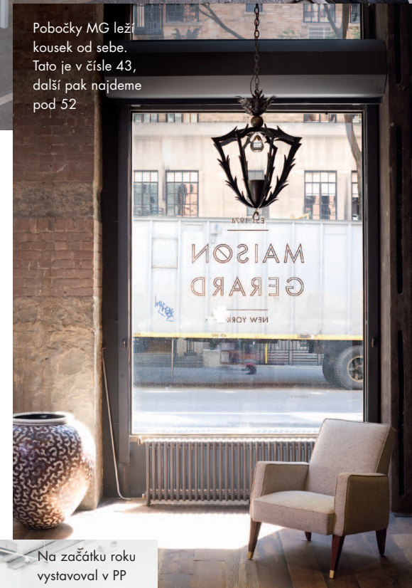
Pobočky MG leží kousek od sebe. To je v čísle 43, další pak najdeme pod 52