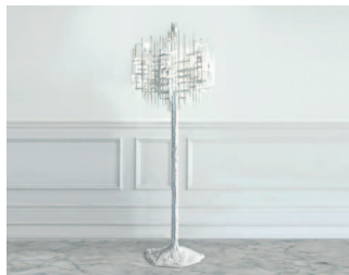
Stalakity inspirované světlo Relic je unikátem od Lary Bohinc pro GF