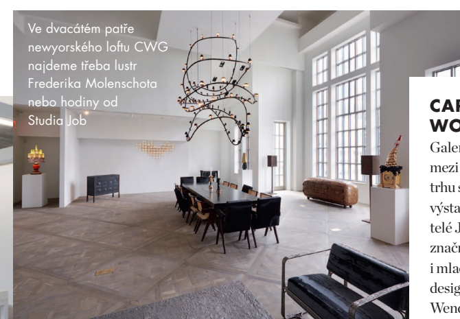
Ve dvacátém patře newyorského loftu CWG najdeme třeba lustr Frederika Molenschota nebo hodiny od Studia Job