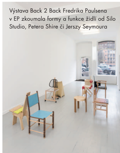
Výstava Back 2 Back Fredrika Paulsena v EP zkoumala formy a funkce židli od Silo Studio, Petera Shire či Jerzsy Seymoura