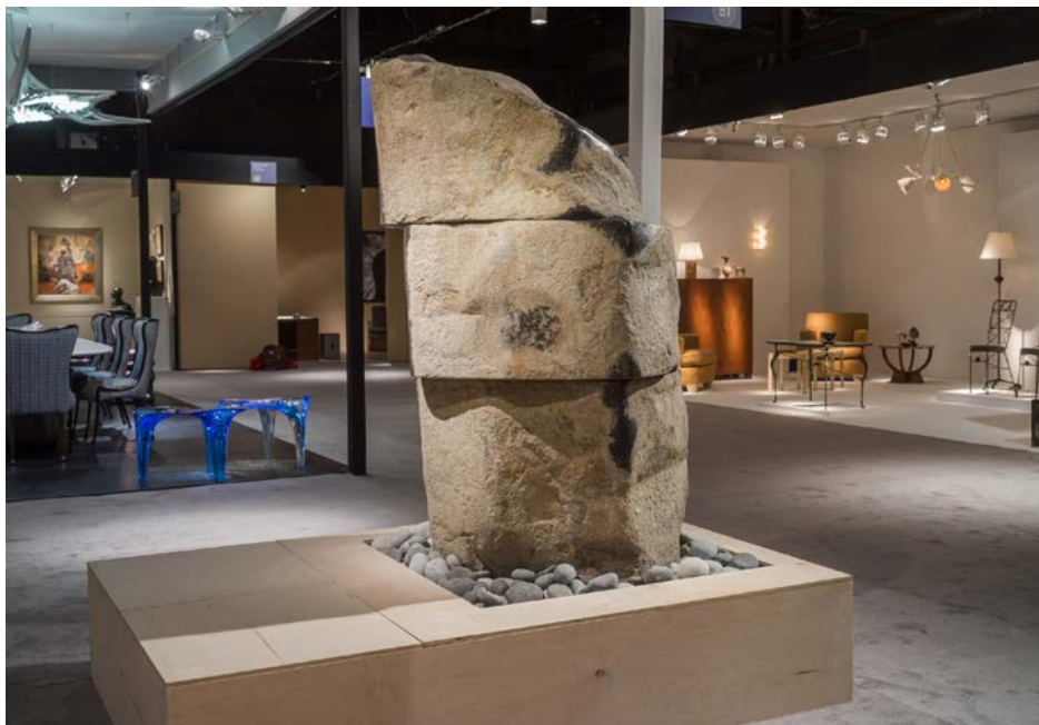
Vue du stand de la galerie Friedman Benda, New York.